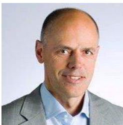
1. Vorsitzender WSV Oberwarmensteinach