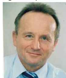
1. Vorsitzender SC Neubau